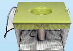
Aqua-Hobby mit Tauchmotor