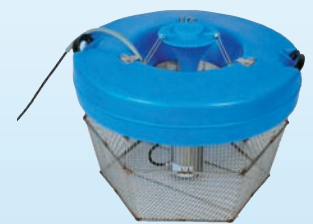
Aqua-Pilz mit Tauchmotor