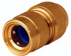
SCHLAUCHANSCHLUSS mit 6 Kugeln 1/2" ohne Wasserstop 1/2" mit Wasserstop 3/4" ohne Wasserstop 3/4" mit Wasserstop