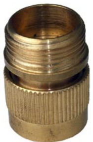
ANSCHLUSS 3/4" Innengewinde Außengewinde 3/4" ohne Wasserstop 3/4" mit Wasserstop