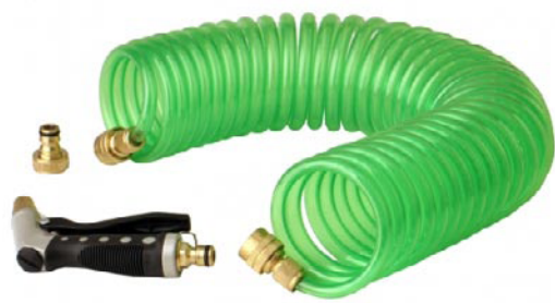
GARTENSPRITZE mit Flexschlauch