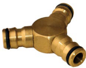
Y-VERTEILERSTÜCK 3 x Steckkupplung